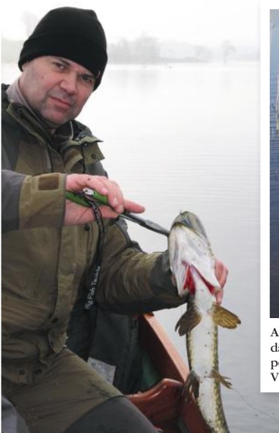
Un brochet pris dans le brouillard du petit matin.