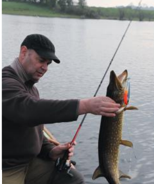
Sur les plateaux, le Busterjerk 2 a une nouvelle fois prouvé son efficacité.