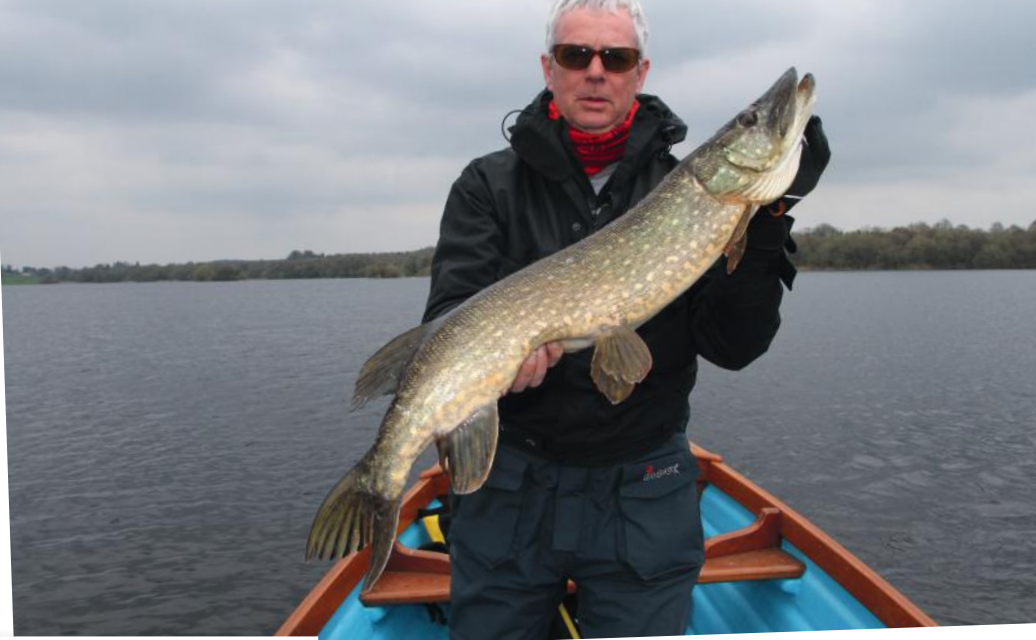
Ces petits lacs contiennent également de jolis poissons qui constituent des bonus bien appréciés.

bien là. Le Lough Oughter mérite à lui seul un séjour complet, car il peut assurément délivrer de réelles belles surprises.