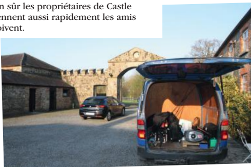
Chaque matin, Alan ou David sont venus nous chercher pour nous amener sur un nouveau coin de pêche. Les possibilités de découvrir de nouveaux secteurs sont énormes avec Castle Hamilton.