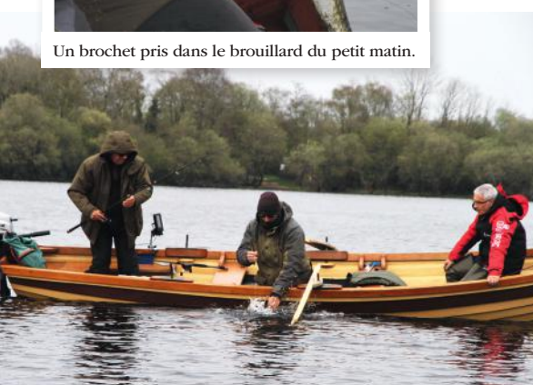
Sur le Lough Oughter, la fin des étroits chenaux qui relient les différentes parties du lac était blindée de poissons blancs, et les brochets n'étaient pas bien loin.