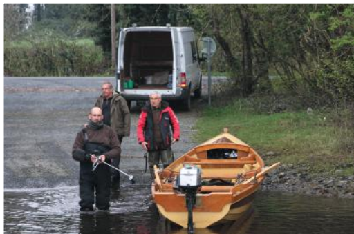
Les barques sont stables et permettent de naviguer en toute confiance sur les gros lacs, d'autant que les motorisations vont être revues.