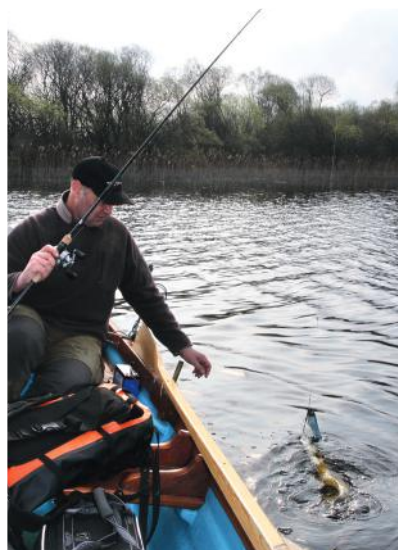
C'est un classique en Irlande, dans les petits lacs, les abords de roselières permettent d'avoir de l'action sur des poissons de taille moyenne.

Si la matinée a été assez prolifique, l'après-midi a été beaucoup plus laborieux et nous avons peiné à trouver des poissons réellement actifs. Quelques poissons de taille modeste sont certes venus agrémenter l'après-midi, qui, malgré tout, ne restera pas longtemps gravé dans nos mémoires. Malgré cela, et bien que la pression de pêche soit loin d'être négligeable sur le lac, le potentiel pour tenir de très gros poissons est